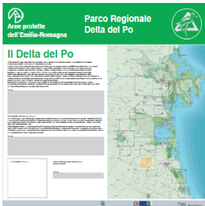
Pannello LATO 'B'