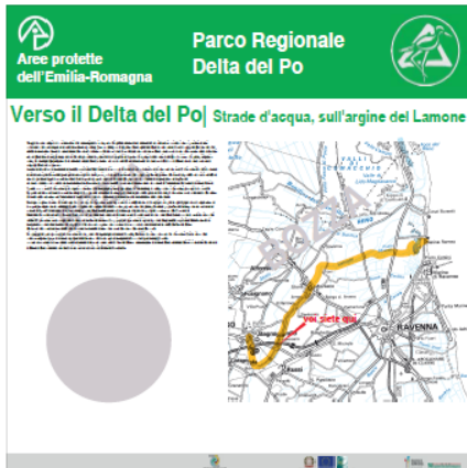
Pannello LATO 'A'