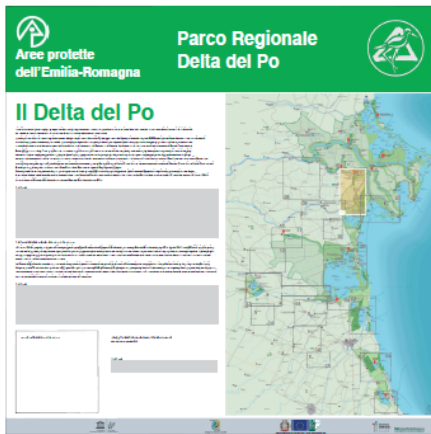
Pannello LATO "B"