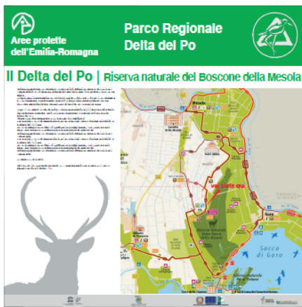
Pannello LATO "A"

Allegato F - Fac-simile cartellonistica informativa da realizzarsi sulla base del "Manuale di immagine coordinata nei comuni area Leader" definita da parte dell'Ente per la gestione dei parchi e delle aree protette – Delta del Po e scaricabile al seguente link: https://www.deltaduemila.net/sito/wp-content/uploads/2021/03/Cartellonistica-Coordinata-Leader.pdf