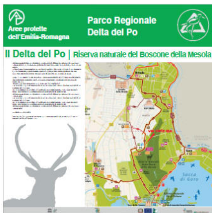
Pannello LATO 'A'

Allegato F- Fac-simile cartellonistica informativa da realizzarsi sulla base dell'immagine coordinata in corso di definizione da parte dell'Ente per la gestione dei parchi e delle aree protette – Delta del Po