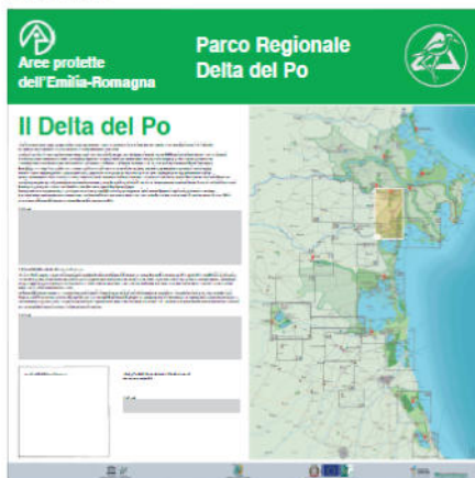
Pannello LATO 'B'