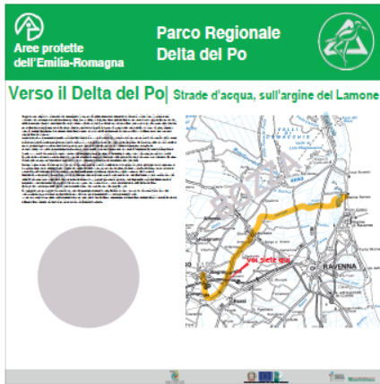
Pannello LATO 'A'