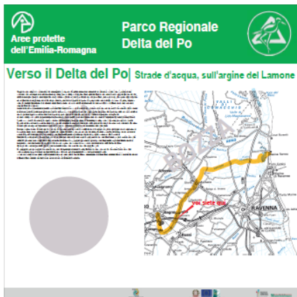
Pannello LATO 'A'

Fondo europeo agricolo per lo sviluppo rurale: l'Europa investe nelle zone rurali