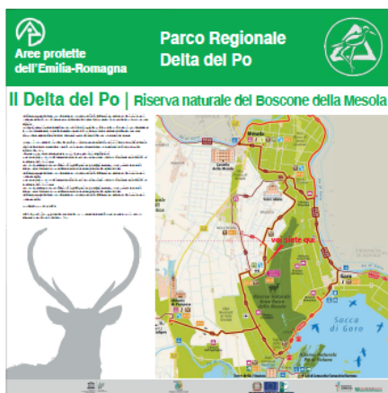
Pannello LATO "A"

Allegato E - Fac-simile cartellonistica informativa da realizzarsi sulla base del “Manuale di immagine coordinata nei comuni area Leader” definita da parte dell'Ente per la gestione dei parchi e delle aree protette – Delta del Po e scaricabile al seguente link: https://www.deltaduemila.net/sito/wp-content/uploads/2021/03/Cartellonistica-Coordinata-Leader.pdf