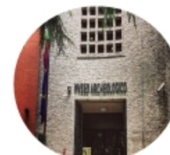
Museo archeologico di Adria