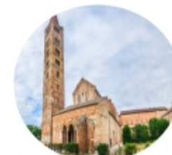
Abbazia di Pomposa